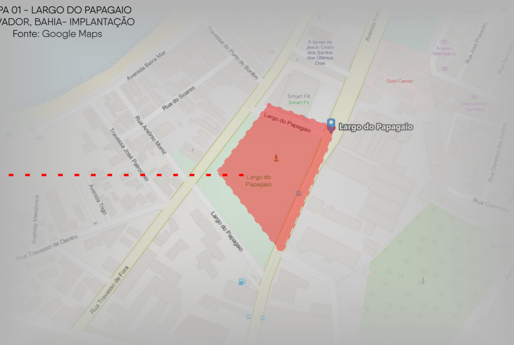
MAPA 01 - LARGO DO PAPAGAIO SALVADOR, BAHIA- IMPLANTAÇÃO

DA PROPOSTA: SENDO O MOBILIÁRIO URBANO PARA PRIMEIRA INFÂNCIA, UMA SÉRIE DE ELEMENTOS COM FUNÇÕES DISTINTAS, A PROPOSTA OPTOU POR SELECIONAR UM ESPAÇO PÚBLICO DA CIDADE DE SALVADOR CHAMADO LARGO DO PAPAGAIO ( FIGURA 01 E 02 E MAPA 01) COMO FORMA DE PROPOR UM CONJUNTO QUE SE DIALOGUEM ENTRE SI, ATRAVÉS DOS ELEMENTOS CONSTRUTIVOS COMO O CONCRETO E A MADEIRA E QUE AO MESMO TEMPO CRIAM UMA IDENTIDADE VISUAL ATRAVÉS DE FORMAS E CORES. NÃO HA DÚVIDAS QUE EXISTE UMA SÉRIE DE OUTROS MOBILIÁRIOS QUE PODERIAM SER AQUI APRESENTADOS, ENTRETANTO FOI DESTACADO ALGUNS QUE SE FEZ INTERESSANTES SENDO O PONTO DE ÔNIBUS, TÓTEN, PLAYGROUND, LIXEIRAS, DOMO, ARCOS DE EQUILÍBRIO E BANCOS.