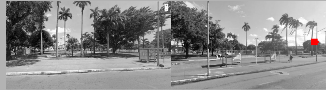
IMAGEM 01 E 02- LARGO DO PAPAGAIO SALVADOR, BAHIA

A PROPOSTA APRESENTADA É UM CONJUNTO DE MOBILIÁRIO URBANO PARA PRIMEIRA INFÂNCIA PARA A CIDADE DE SALVADOR, BAHIA E VISTO QUE O MOBILIÁRIO POR MAIS QUE TENHA FUNÇÕES EXCLUSIVAS EM UM ESPAÇO FAZ PARTE DE UM CONJUNTO.