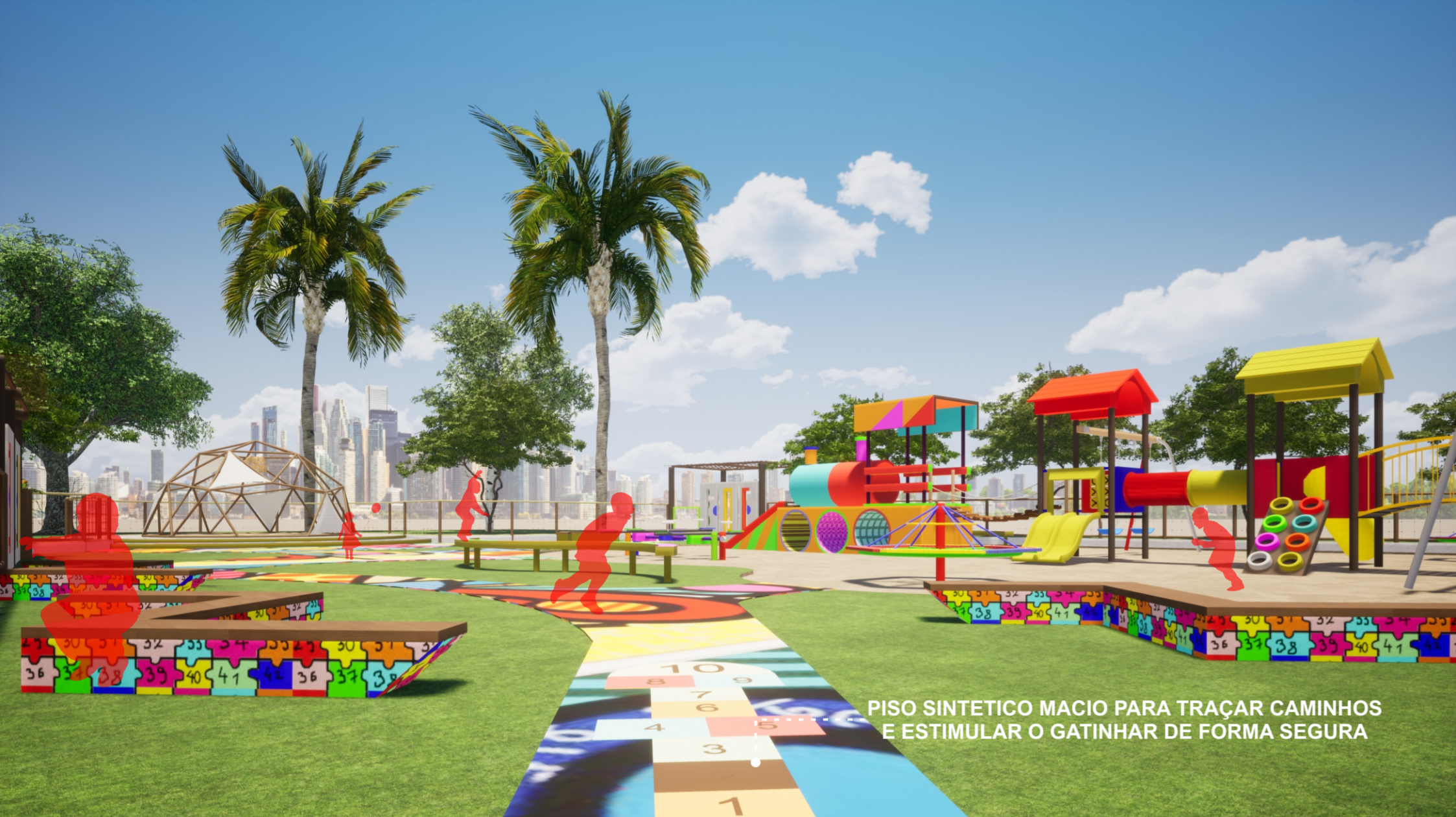
PISO SINTETICO MACIO PARA TRAÇAR CAMINHOS E ESTIMULAR O GATINHAR DE FORMA SEGURA