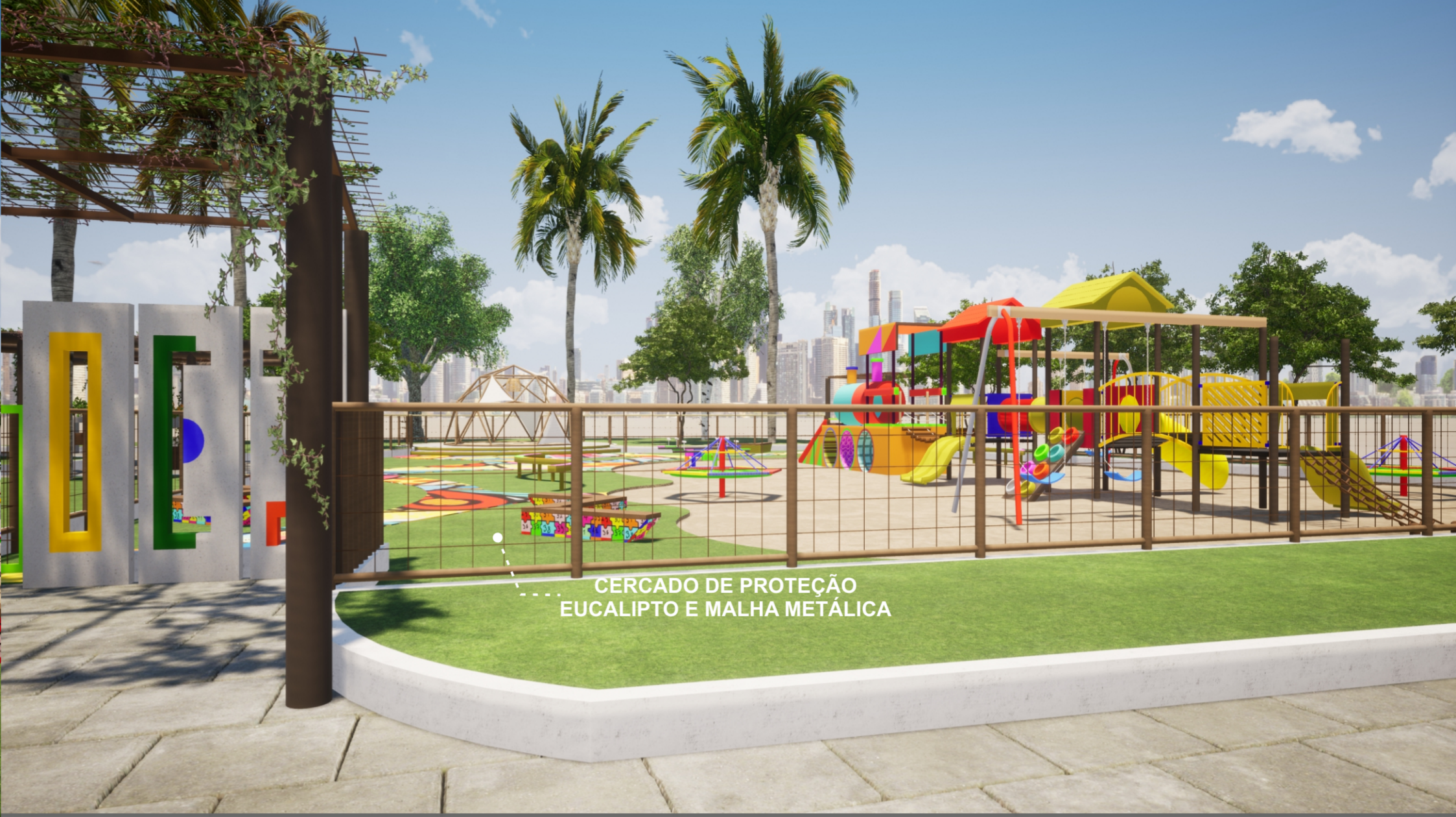
CERCADO DE PROTEÇÃO EUCALIPTO E MALHA METÁLICA

PLAYGROUND: ELEMENTO INDISPENSÁVEL SENÃO O MAIS IMPORTANTE MOBILIÁRIO PARA A PRIMEIRA INFÂNCIA. A PROPOSTA É COMPOSTA POR UM DOMO GEODÉSICO FEITO DE BAMBU TRATADO CONECTADOS POR TUBOS DE PVC QUE RECEBERÁ ALGUNS FECHAMENTOS EM MATERIAL SINTÉTICO COLORIDO. ESSE ESPAÇO PODERÁ SER UTILIZADO POR EDUCADORES OU ACOMPANHANTES PARA RODA DE MÚSICA, TEATRO DE FANTOCHE E RODA DE HISTÓRIAS E ATIVIDADES COMO ARTESANATO E PINTURA, E JOGOS. ALÉM DO DOMO, UM LAGO DE AREIA COMPORTA A MARIA FUMAÇA, MOBILIÁRIO QUE PODERÁ SER FEITO EM CONCRETO ONDE MANILHAS PINTADAS CONECTAM UMA SÉRIE DE OUTROS BRINQUEDOS COMO ESCORREGADORES, BALANÇOS, TREPA TREPA, GANGORRA GIRA GIRA E PASSAGENS COM INTUÍTO DE ESTIMULAR O EQUILÍBRIO, A IMAGINAÇÃO E RACIOCÍNIO. VALE RESSALTAR A IMPORTÂNCIA DE BRINQUEDOS ADAPTADOS VISANDO A ACESSIBILIDADE PARA CRIANÇAS QUE TENHAM ALGUM TIPO DE DEFICIÊNCIA FÍSICA INTELLECTUAL.